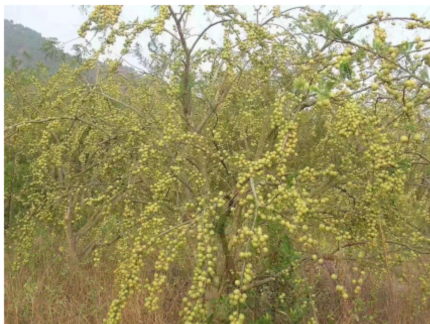
图 8 丰收的余甘果实