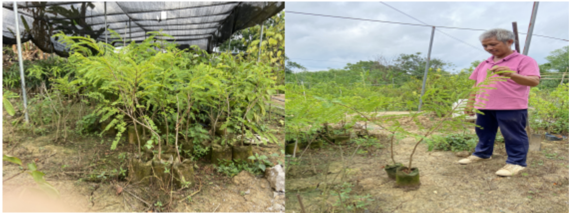
图 2 南宁苗卉欣花果苗木场

图 2 中的余甘子嫁接苗为售卖中的种苗，采用的也是白色无纺布的育苗袋，主要有两年生、三年生种苗，一般苗龄越大更快结果。