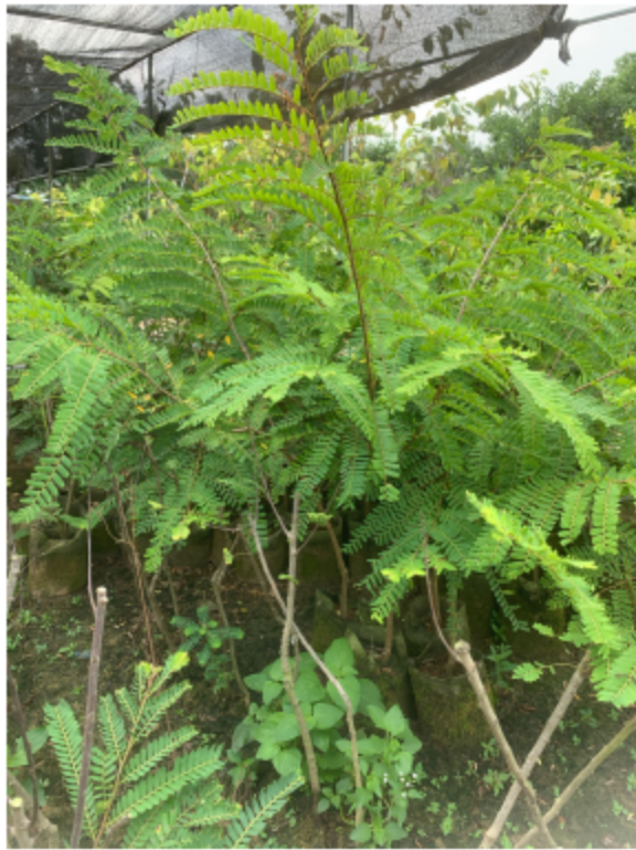
图 6 余甘子三年生苗

通过实地测量和询问种植者,发现规模化种植良好的余甘子种苗:一年生苗平均苗株高均能达到 40 cm 及以上,茎径不低于 0.7 cm;两年生苗平均苗株高均能达到 70 cm 及以上,茎径不低于 0.8 cm;三年生苗平均苗株高均能达到 100 cm 及以上,茎径不低于 1.3 cm;四年生苗平均苗株高均能达到 120 cm 级以上,茎径不低于 1.8cm。以茎径作为种苗等级的主要判定标准。在根据《DB35/T 1231 余甘子栽培技术规范》上规定的要求,制定了余甘子种苗的等级规范。