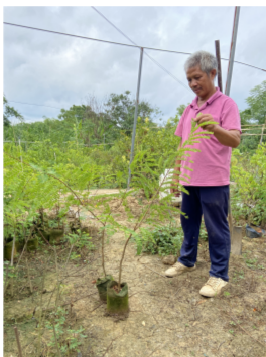
图 5 余甘子两年生苗