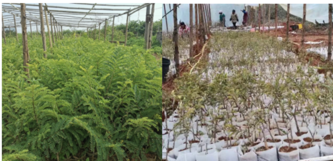
图 1 广西四季余甘果投资有限公司余甘子嫁接苗育苗基地