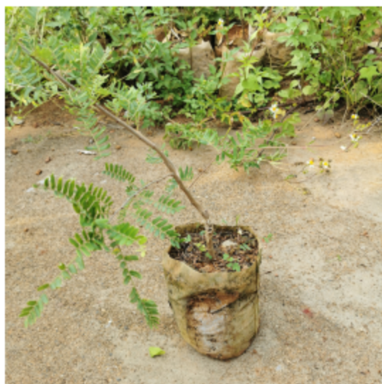
图 4 余甘子一年生苗