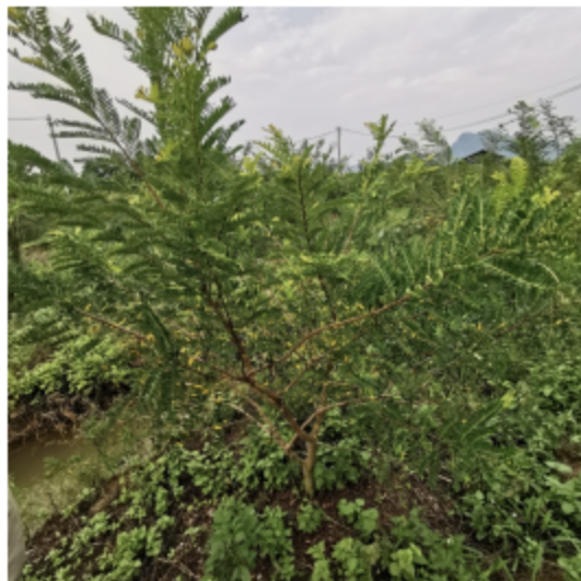
图 3 多年生余甘果树